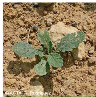
moutarde des champs