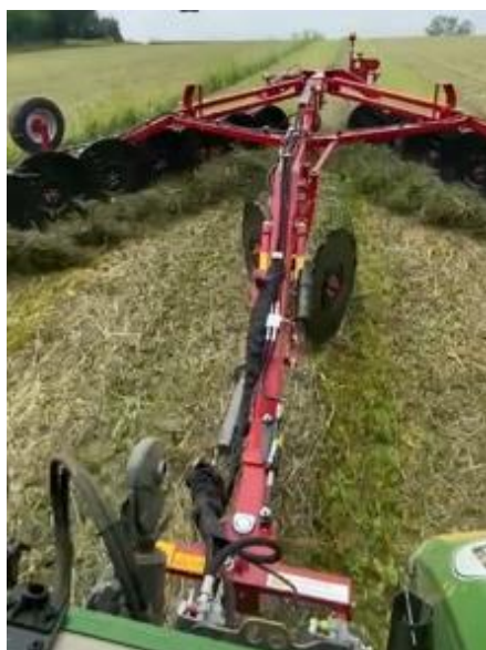
Enrubanné luzerne et graminée (1 ère coupe). Valeur alimentaire