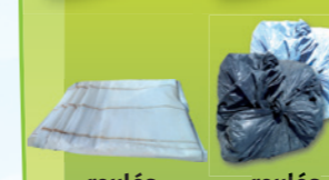
roulés roulés séparer les films clairs des films sombres