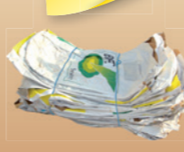
en fagot stocker au sec