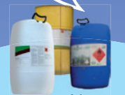
Produits phytopharmaceutiques et oligo-éléments