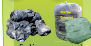
ficelés en sac ou en boule

Ficelles plastiques Filets balles rondes