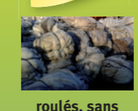
roulés, sans mandrins