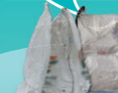
engrais, amendements, semences et plants