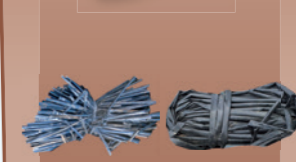
en fagot ou roulées