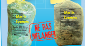
en sac en sac