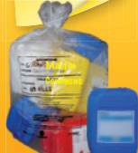
en sac ou à l'unité sans les bouchons