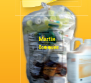
en sac ou à l'unité sans les bouchons