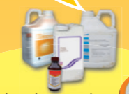
phytopharmaceutiques et oligo-éléments