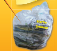
en sachet avec les bouchons