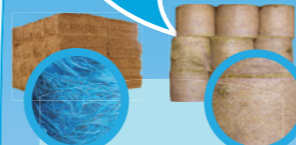
Conditionnement des fourrages, palissage vigne et horticulture Conditionnement balles rondes

Ficelles plastiques Filets balles rondes