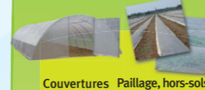
Couvertures de serres Paillage, hors-sols, solarisation, petits tunnels