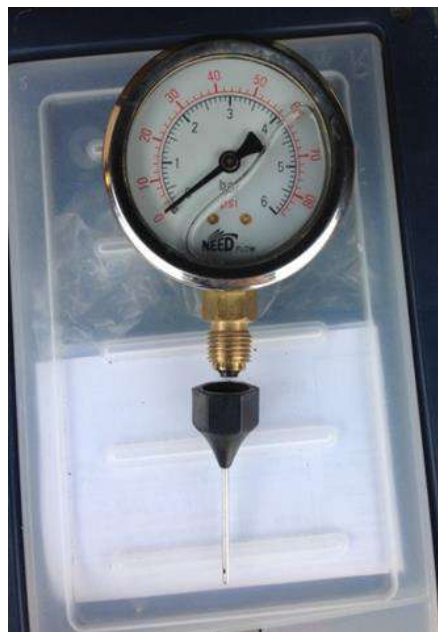
Manomètre à aiguille fine pour prise de pression