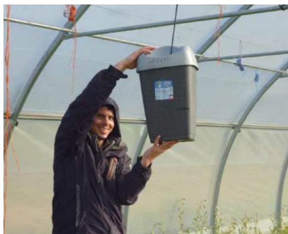
Contrôle de débits sous asperseurs

On recherche moins de 10 % de variation de débit entre les asperseurs de début de rampe et fin de rampe.