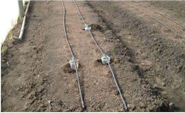
Contrôle de débits sous goutte-à-goutte