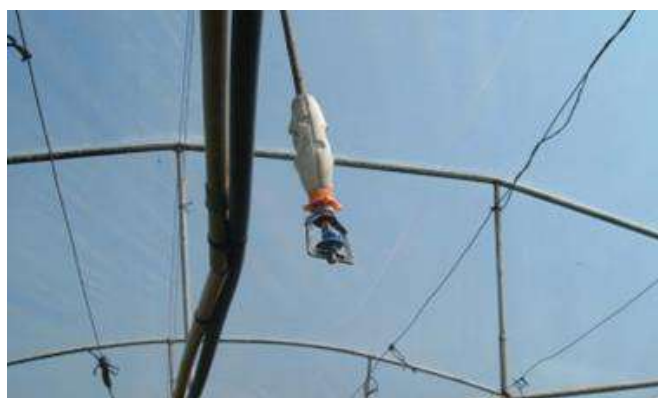
Aspersion sous tunnel